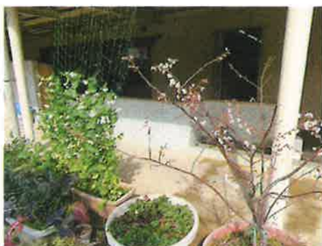
園内にも春が訪れています！