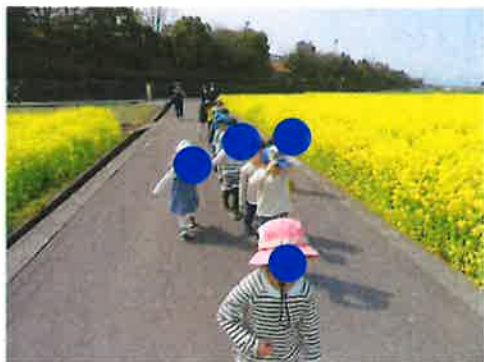
「帰るよー」と並びながら、園バスに戻りました。