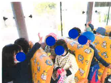
帰りのバスでは、手を振り合いながらおしゃべりする様子も見られました。